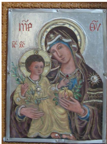
Imagen de Nuestra Señora de Efraim (Taybeh, antiguo Efraim, Palestina)

En el Mensaje del día de hoy del 2009, el Papa nos dice: "Hemos puesto nuestra esperanza en el Dios vivo" (1 Tm 4,10). En Jesús tendremos ideales, sueños y proyectos, un sentido para vivir, sabemos qué será de mi vida, cómo alcanzar la felicidad, nos ayuda a entender por qué el sufrimiento, la enfermedad y qué hay más allá de la muerte. Nos ayuda en las dificultades en los estudios, incomprendiones en la familia, dificultades en la amistad... vamos a ir a Jesús estos días de la mano de María, pues como decía san Bernardo, "si se levantan los vientos de las tentaciones, si tropiezas... mira a la estrella, llama a María... En los peligros, en las angustias, en las dudas, piensa en María, invoca a María... Siguiéndola, no te desviarás; rogándole, no desesperarás; pensando en ella, no te perderás. Si ella te tiene de la mano no caerás; si te protege, nada tendrás que temer; no te fatigarás si es tu guía; llegarás felizmente al puerto si ella te es propicia", con ella llegaremos a la Resurrección de Jesús, y al cielo.